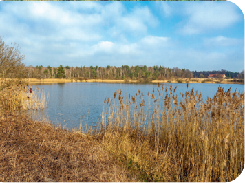
Von der Industriemast zum Angelgewässer – die alte Tongrube Guttau