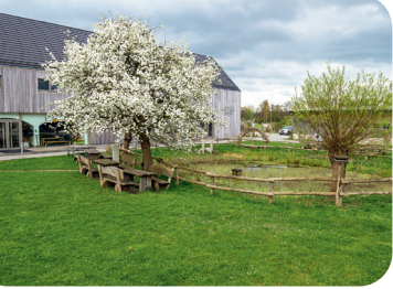
Vom Stallgebäude zum Besucherzentrum – das HAUS DER TAUSEND TEICHE