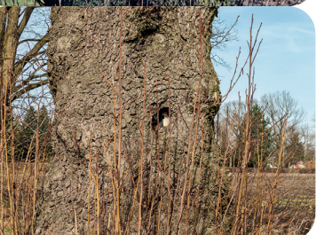
Vom Schild am Baum zum Schild im Baum – alte Erle bei Förstgen