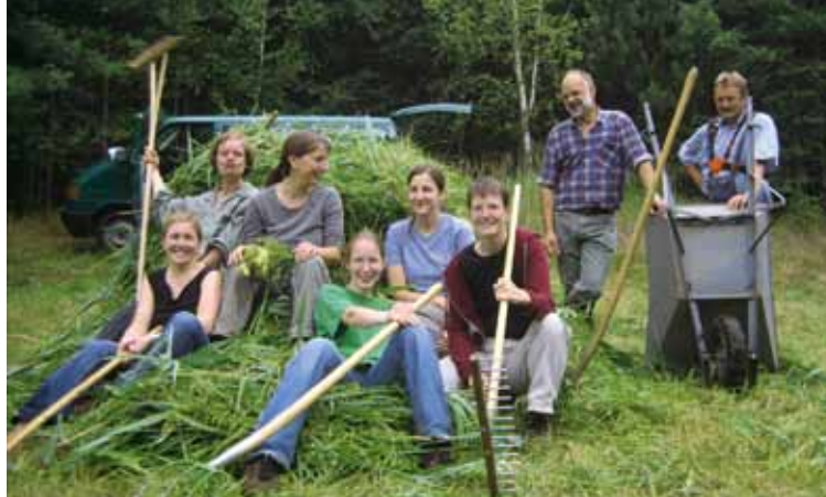
Im Einsatz zum Schutz von Feuchtwiesen

Schutzgebiete sind zudem auf Unterstützer und Unterstützerinnen angewiesen, die sich in vielfältiger Weise ehrenamtlich für sie einsetzen und somit zu aktiven „Insidern“ werden. Diese Freiwilligen ersetzen keine Hauptamtlichen; durch ihren Einsatz ergänzen und bereichern sie die Arbeit Hauptamtlicher und sind damit wertvolle Partnerinnen und Partner im Team der Schutzgebietsbetreuung.